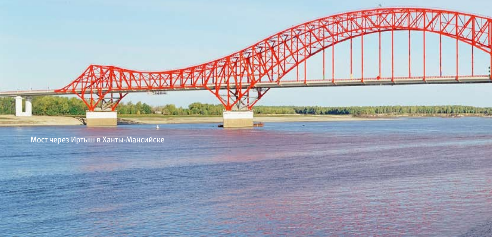
Мост через Иртыш в Ханты-Мансийске

Наша совместная работа на множестве объектов наглядно продемонстрировала: каким бы масштабным и сложным ни был наш замысел, заложенный в проект, заводские специалисты — мастера своего дела — воплотят его в сотнях и тысячах тонн